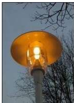
Ampoule Sodium basse pression

Ci-dessous un exemple de mise en lumière d'un parking de la ZAC du Val Joly (59), suivant les préconisations énoncées :