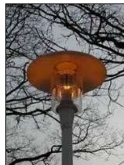
Focalisateur supérieur et latéral